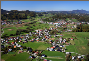
Pogled na Poljčane iz zraka

Velik odstotek lokalnega prebivalstva se vključuje v delovanje lokalnih društev, klubov in drugih prostovoljskih organizacij na kulturnem, turističnem, športnem, kmetijskem, humanitarinem ali kakšnem drugem področju. Ravno društva so največkrat pobudniki in organizatorji lokalnih prireditev, ki poskrbijo za pestro družabno življenje v občini in pravišajo tako domačim kot obiskovalcem obotnih krajev. Med pomembnejše prireditve, ki so še tradicionalnega značaja, spadajo: karnevalsko prireditev, Slovenski poljski večer, Krovčev veser, Grajski večer, Martinov pohod, Božični koncerti na pihala, Žive jadic in druge.