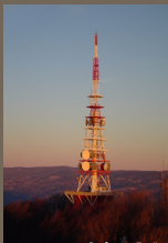
Stolp na Boču