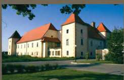
Grad v vasi Muretinci

Občina Gorišnica se ponaša s čudovito kmečko hišo – Dominkovo domačijo. Po mnenju strokovnjakov Zavoda za varstvo kulturne dediščine Slovenije velja za najstarejšo v celoti ohranjeno hišo, grajeno v panonkem stilu. Stara je nad tristo let.